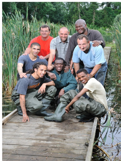
1 ère session du Chantier "Gestion des zones humides"