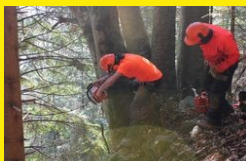
Formation "abattage directionnel"

AISE organise également des sessions de formation, ouvertes à tous les publics, permettant de répondre à des demandes spécifiques en gestion et entretien des milieux (interventions en zones humides et aquatiques, sécurité d'utilisation et maintenance des machines thermiques, abattage directionnel, législation des EPI... ).